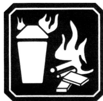
FUEGO CLASE A

Los agentes extintores más utilizados para combatir este tipo de fuego son Agua, Polvo Químico Seco multipropósito y espumas.