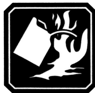
FUEGO CLASE B

Los agentes extintores más utilizados para combatir este tipo de fuegos son Polvo Químico Seco, Anhídrido Carbónico y Espumas.