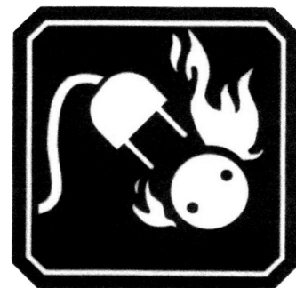
FUEGO CLASE C

Por seguridad de las personas deben combatirse con agentes no conductores de la electricidad como Polvo Químico Seco y Anhídrido Carbónico.