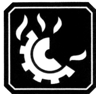
FUEGO CLASE D

Los agentes extintores son específicos para cada metal.