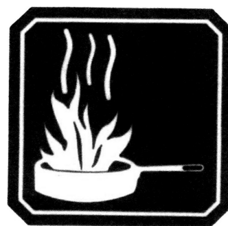
FUEGO CLASE K

Se requieren agentes extintores específicos.